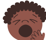
BORED بی حوصله