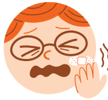
HURT صدمه دیده