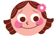
SHY خجالت زده