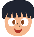
EXCITED هیجان زده